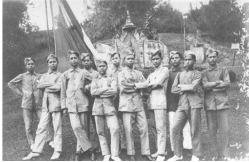
ក្រុមស្ម័គ្រចិត្តកម្ពុជាត្រៀមខ្លួនប្រយុទ្ធសង្គ្រាមលោក (1916)

ពិព័រណ៍ថ្មីមួយនៅសារមន្ទីរជាតិកម្ពុជាក្នុងរាជធានីភ្នំពេញ នឹងបង្ហាញពីតួនាទីនៃប្រទេសកម្ពុជា ក្នុងអំឡុងសង្គ្រាមលោកលើកទីមួយ និងសារៈសំខាន់នៃបេតិកភណ្ឌក្រោមទឹក។