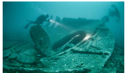
Divers at a shipwreck from WWI

In this exhibition, maritime underwater heritage is key. All Cambodians who participated in the Great War were transported to Europe by boat, and naval combat was a major element during the conflict. Unfortunately, many soldiers died in shipwrecks and the remnants of these important battles are found underneath the surface. The exhibition shows how important underwater cultural heritage is as part of today’s world heritage.