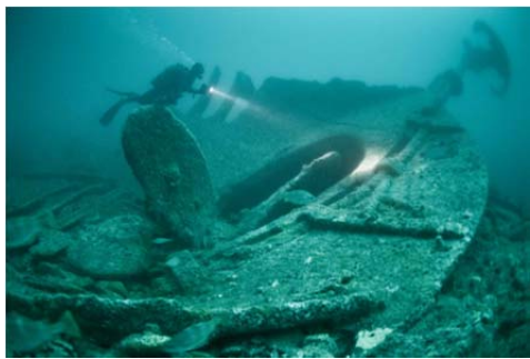
អ្នកមុជទឹកនៅទីលានកប៉ាល់លិចនៅសង្គ្រាមលោកលើកទីមួយ

"មានមនុស្សជាច្រើនមិនបានដឹងថាប្រទេសកម្ពុជាបានរួមចំណែកធ្វើសង្គ្រាមលោកលើកទីមួយទេ ប៉ុន្តែនេះជាកាតព្វកិច្ចរបស់ពួកគេខណៈពេលដែលប្រទេស កម្ពុជាស្ថិតក្រោមអាណាព្យាបាលបារាំង" មានប្រសាសន៍ដោយលោកហ្វីលីពដឡង់ អ្នកជំនាញផ្នែកវប្បធម៌នៅអង្គការយូណេស្កូនៅរាជធានីភ្នំពេញ។ ប្រជាជនកម្ពុជាជាច្រើននាក់ត្រូវបានបញ្ជូនទៅ ប្រយុទ្ធនៅជួរមុខនៅអឺរ៉ុប ពិព័រណ៍នេះនឹងផ្តល់នូវការយល់ដឹងថ្មីមួយទៀតទាក់ទងនឹងរឿងរ៉ាវទាំងនេះ។ នៅក្នុងពិព័រណ៍នេះ បេតិកភណ្ឌនៅក្រោមទឹកសមុទ្រ គឺជាប្រធានបទដ៏សំខាន់។ ពលរដ្ឋកម្ពុជាទាំងអស់ដែលបានចូលរួមក្នុងសង្គ្រាមនេះត្រូវបានដឹកទៅកាន់អឺរ៉ុបតាមកប៉ាល់ ហើយសមរម្យមិជ្ឈិកជាផ្នែកដ៏សំខាន់មួយក្នុងអំឡុងពេលជម្លោះនេះ។ ជាអកុសល សង្គ្រាមនេះបានបន្សល់នូវ សាកសព ទាហ៊ាន និងសំណល់ បាក់បែកពីការប្រយុទ្ធទាំងនោះនៅបាតសមុទ្រ។ ពិព័រណ៍នេះបង្ហាញពីសារៈសំខាន់នៃបេតិកភណ្ឌក្រោមទឹកដែលជាផ្នែកមួយនៃបេតិកភណ្ឌពិភពលោកនៅពេលបច្ចុប្បន្ននេះ។